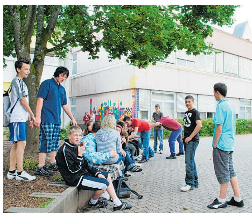
Die Regionale Schule, bald Realschule plus, in Wallhalben.

Produktion dieser Seite: Mathias Schneek Ulrike Otto